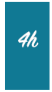
1re discipline de spécialité